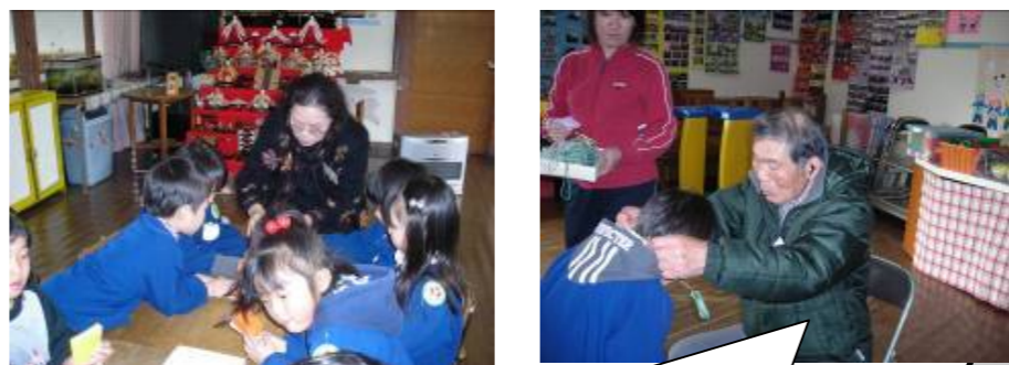
卒園おめでとう! 記念のメダルを贈呈!

幼稚園訪問が再開されました。今後も園児たちと折り紙作業を通じて交流を図っていききたいと思います。